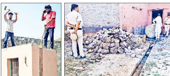
भुना। चंद्रावल गांव में लाल डोरे की गली से अवैध कब्जा हटाने कब्जाधारी व मौके पर मौजूद प्रशासनिक टीम।