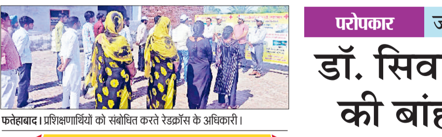
फतेहाबाद। प्रशिक्षणार्थियों को संबोधित करते रेडक्रॉस के अधिकारी।