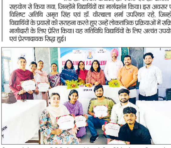
सिरसा। डेम्पो संसद गतिविधि में भाग लेने वाले विद्यार्थियों को सम्मानित करते हुए।