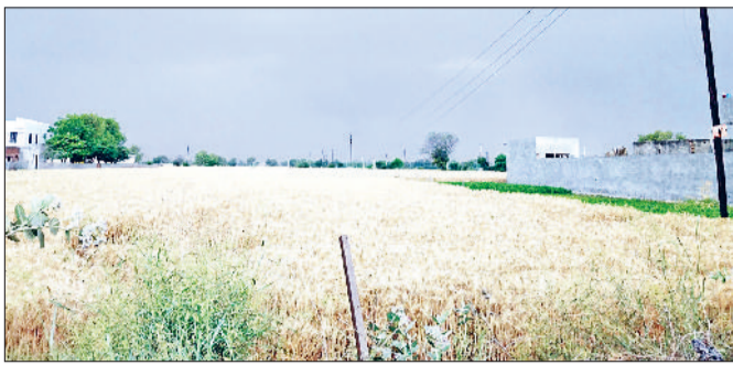
फतेहाबाद। गेहूँ की पकी फसल पर छाये बादल।

30 अप्रैल तक मौसम में लगातार हो सकता है बदलाव