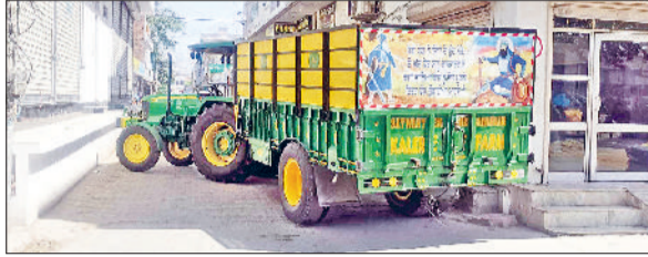
जाखल। ट्रैक्टर अड़ाकर बंद किया गया मंडी का रास्ता।

जिले के जाखल अनाज मंडी में शुक्रवार सुबह उस समय स्थिति तनावपूर्ण हो गई जब अपनी मांगों को लेकर आक्रोशित किसानों ने मंडी के दोनों मुख्य द्वारों पर ताला जड़ दिया और ट्रैक्टर-ट्रालियां अड़ाकर आवागमन पूरी तरह ठप कर दिया। किसानों के इस प्रदर्शन के कारण मंडी के बाहर और संपर्क मार्गों पर वाहनों की कई किलोमीटर लंबी कतारें लग गईं, जिससे आमजन और अन्य वाहन चालकों को भारी परेशानी का सामना करना पड़ा। प्रदर्शनकारी किसानों का आरोप है कि मंडी के अंदर गेहूं की फसल डालने के लिए अब बिल्कुल भी जगह शेष नहीं बची है। मौके पर