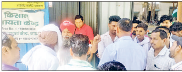
जाखल। किसानों से बातचीत करते अधिकारी।

पहुंचे मार्केट कमिटी सचिव ने किसानों को समझाने का प्रयास किया। उन्होंने प्रशासन के नियमों का हवाला देते हुए स्पष्ट किया कि अभी तक मंडी से बाहर अनाज गिराने की आधिकारिक अनुमति प्राप्त नहीं हुई है। सचिव ने दावा किया कि मंडी में पर्याप्त जगह उपलब्ध है और प्रशासन यह सुनिश्चित करेगा कि किसी भी किसान को अपनी फसल उतारने में दिक्कत न आए। नियमों के अनुसार फिलहाल गेहूं की फसल मंडी के अंदर ही गिरवाई जाएगी। हालांकि, किसान इस दलील से संतुष्ट नहीं दिखे और करीब एक घंटे तक मंडी के गेट जाम रहे। बाद में अन्य किसान प्रतिनिधियों के साथ बैठक और विचार-विमर्श के निर्णय के बाद जाम को खोला गया। हंगामे की सूचना मिलते ही जाखल थाना प्रभारी सुरेश कुमार पुलिस बल के साथ मौके पर पहुंचे। उन्होंने स्थिति का जायजा लिया और शांति व्यवस्था बनाए रखने के लिए किसानों तथा आदती वर्ग से बातचीत की। पुलिस की मौजूदगी में अधिकारियों ने किसानों को शांत करवाया और यातायात सुचारु कराया। एक ओर जहां विवाद चल रहा था, वहीं दूसरी ओर मार्केट कमिटी ने मंडी में गेहूं की सरकारी खरीद की प्रक्रिया भी शुरू करवा दी है। इसके लिए हरियाणा वेयरहाउस की एजेंसी को बुलाया गया। फिलहाल जाम खोल दिया गया है, लेकिन किसान अभी भी अपनी मांग पर अड़े हुए हैं कि उन्हें निजी प्लॉटों में फसल उतारने की अनुमति दी जाए। प्रशासन स्थिति पर पैनी नजर बनाए हुए है ताकि दोबारा टकराव की स्थिति पैदा न हो।