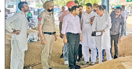
सिरसा। अनाज मंडी में खरीद कार्य का जायजा लेते एसडीएम।